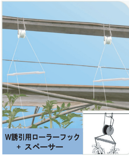
W誘引用ローラーフック + スペース