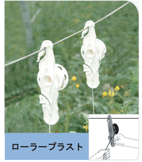
ローラープラスト