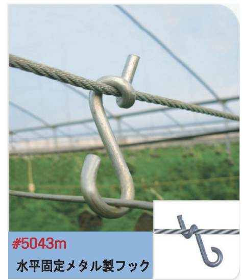
#5043m 水平固定メタル製フック