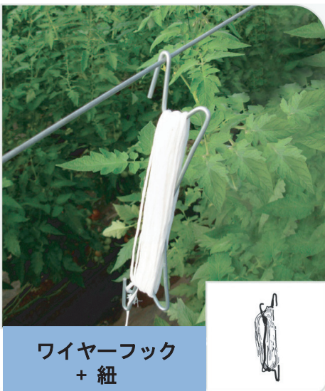
ワイヤーフック + 紐