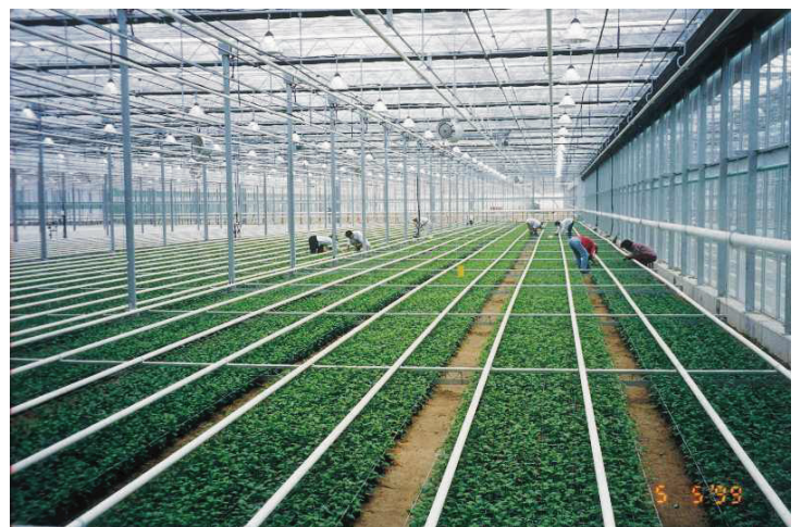
使用例：グリーンハウス