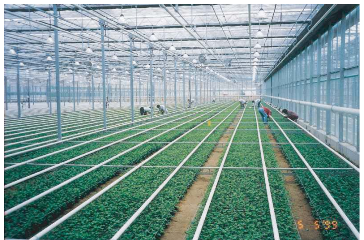
使用例：グリーンハウス